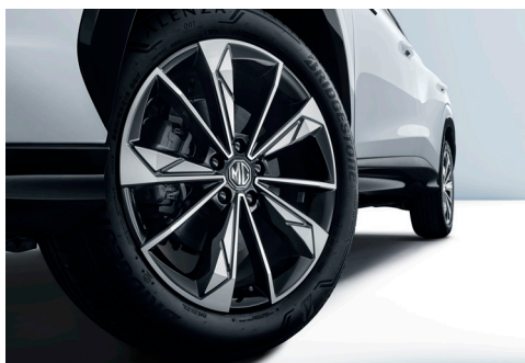
Jante aliaj 19"