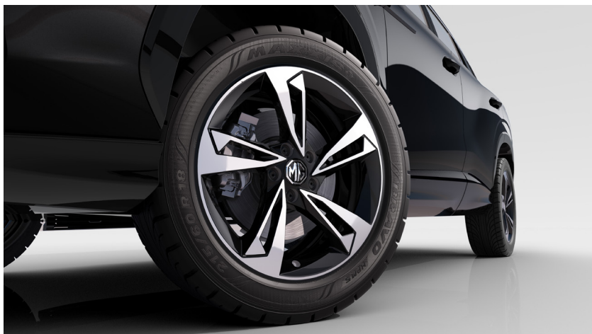
Jante aliaj 19"